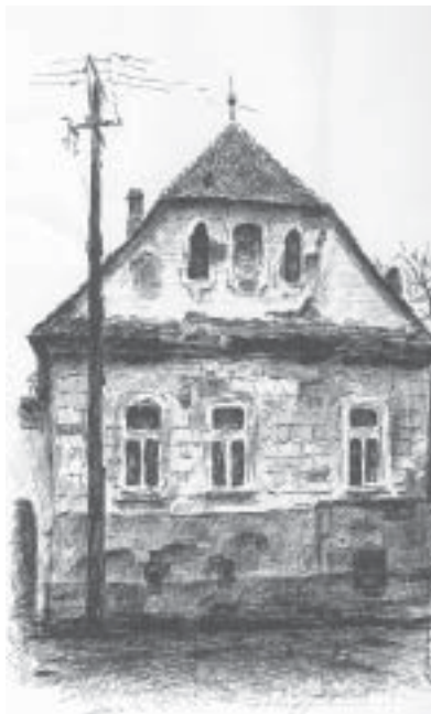
Casa de pe str. C. Lacea nr. 32 (1773)