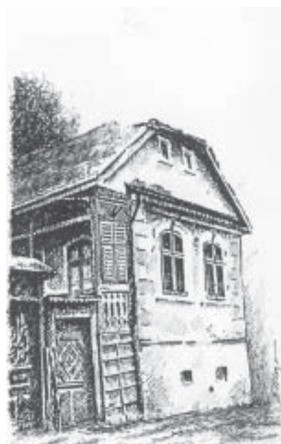
Casă din Șchei

noiembrie 1943), carî prin sîrguință, muncă cîstită și truda neobosită, au clădit în a. 1906 și 1910, și au trăit pînă la trecerea în eternitate în această casă, în credință și evlavie către Dumnezeu. Brașov, 1944. Mai mult ca sigur, această placă a fost fixată de nepoți ca un semn de recunoștință față de înaintașii care au durat prin hărnicie construcția.