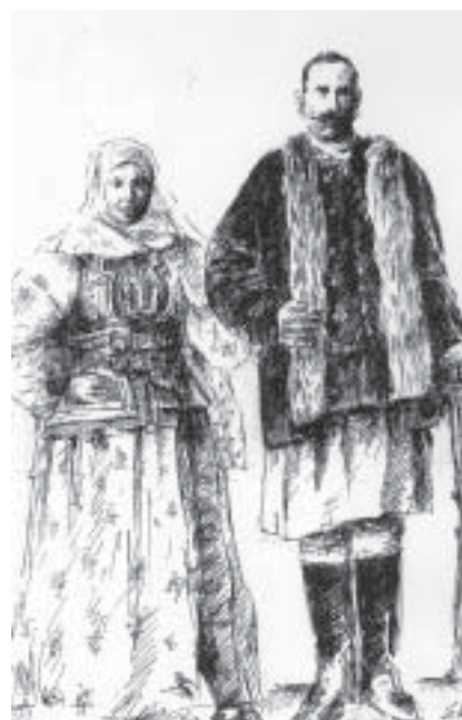
Șcheieni în costume specifice